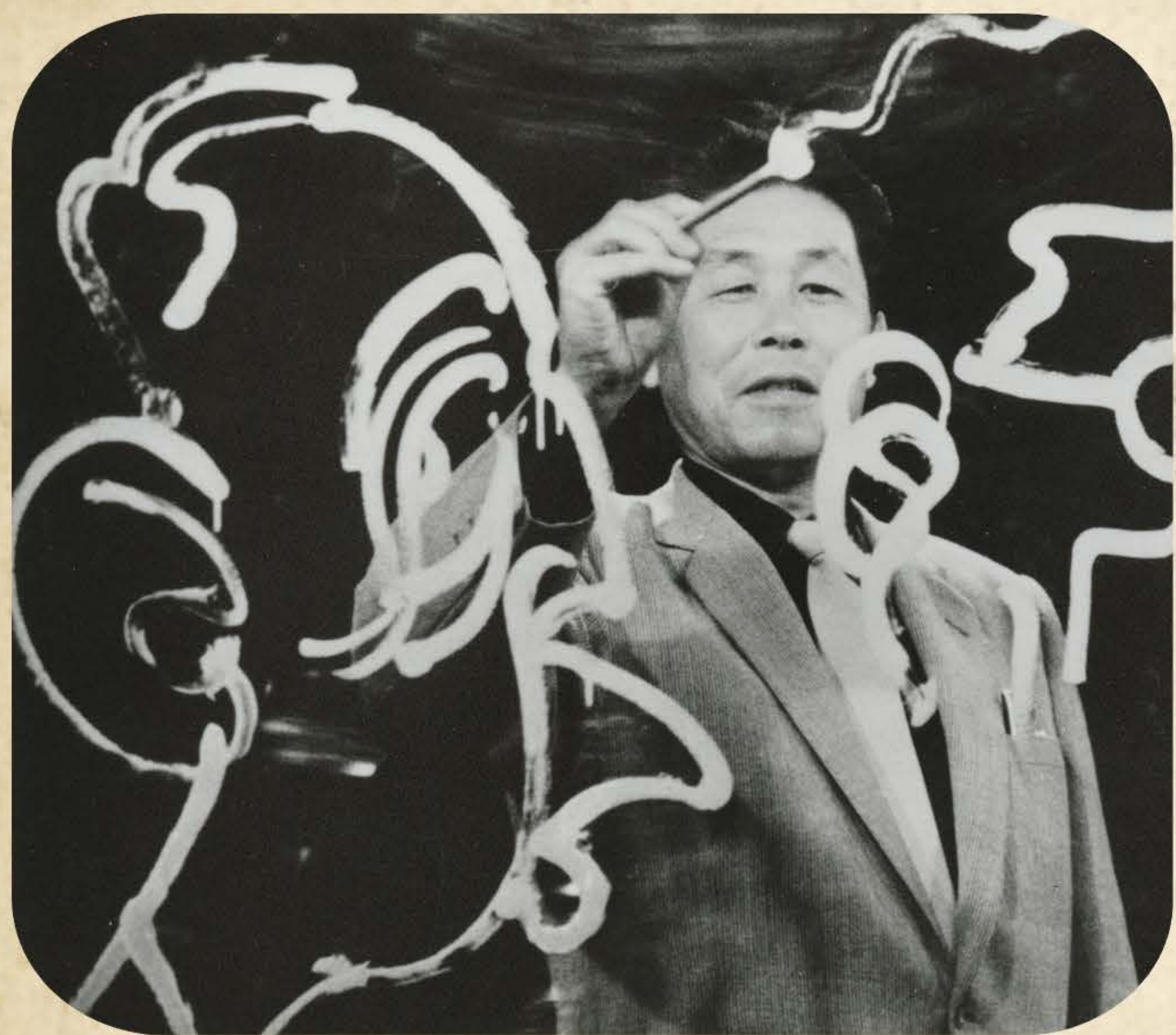
似顔絵を描く良輔。 左に描かれているのは岸信介首相。